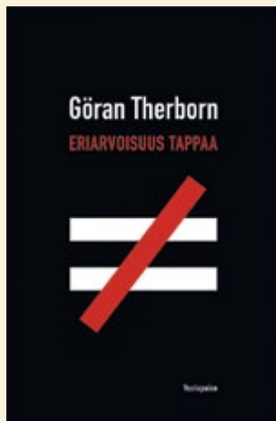
Göran Therborn ERiarvoisuus TAPPAA