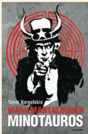
Yanis Varoufakis MAAILMANTALouden MINOTAUROS