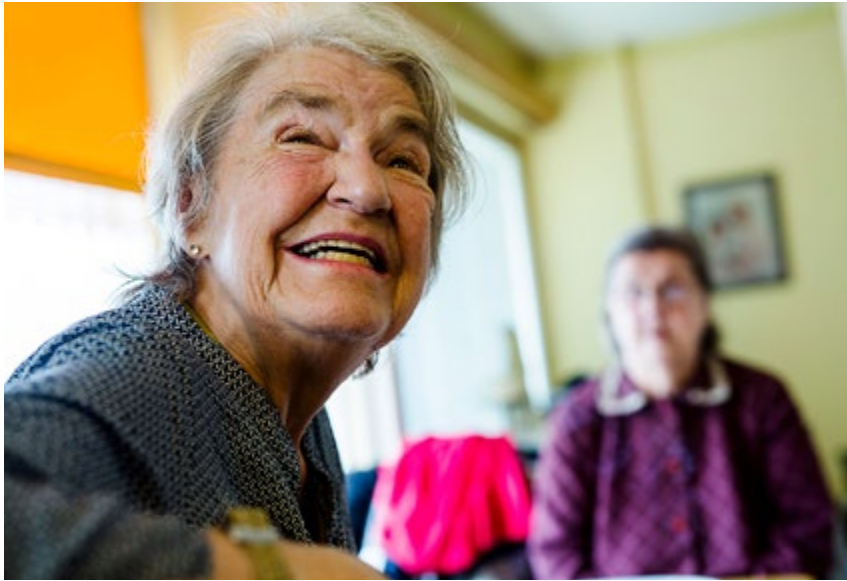
Kaksikko juo Rosénin luona kahvit lähes päivittäin.

kana olevien vanhusten ajatuksia unelmien kesästä. Toiveet ovat yksinkertaisia: ”Jäätelö”, ”Puutarhanhoito”, ”Uinti Hangossa” tai ”Varpaat hiekassa”.