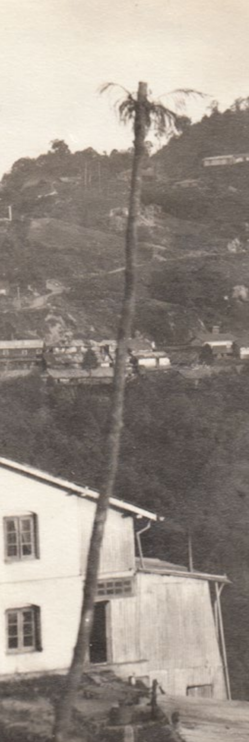
Ghoomin lähetystalo. Kuva 1890-luvulta.