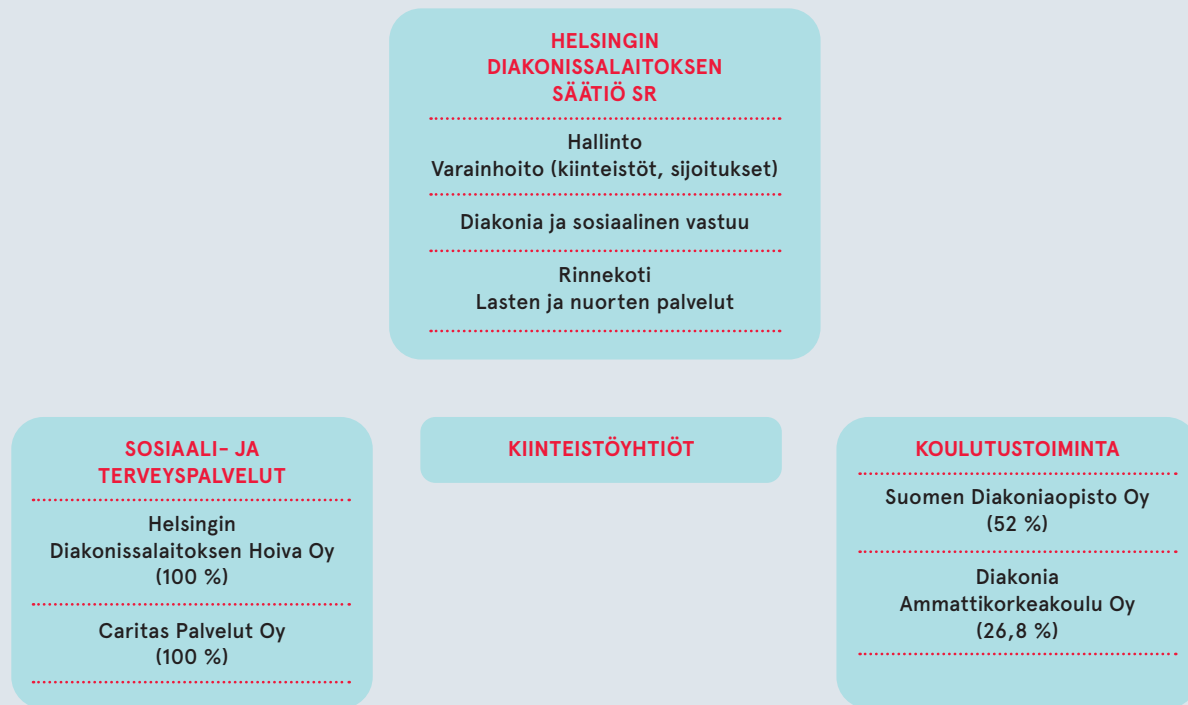
KUVA 1. DIAKONISSALAITOKSEN SÄÄTIÖKONSERNIN JURIDINEN RAKENNE (31.12.2021)